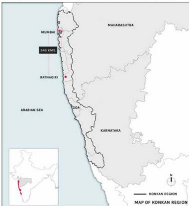
Carte de la région de Konkan, côte occidentale de l'Inde © Forum Vies mobiles

La caractéristique de ce développement est de voir se consolider des modes de vie reposant sur la circulation entre villes et villages. Il est impossible de quantifier le nombre de familles qui organisent ainsi leur existence car il n'existe pas d'outil statistique permettant de mesurer l'ampleur du phénomène. Mais, sur la base d'échantillons ethnographiques, nous estimons qu'il concerne quelques millions de personnes à Mumbai et des centaines de millions à l'échelle de l'Inde, en particulier les classes